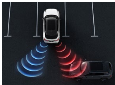
RCTA - avertizor pentru traficul perpendicular din spate